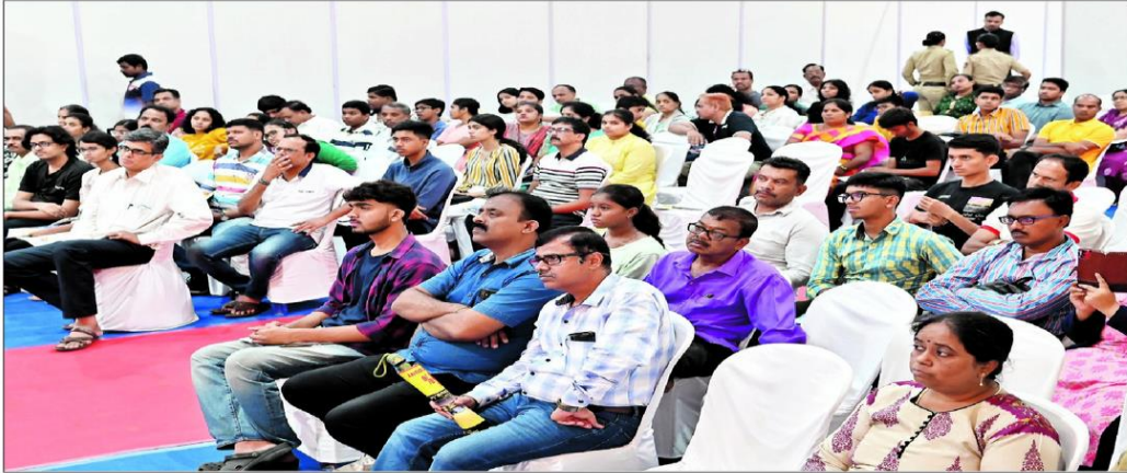
ಎಜುಕೇಷನ್ ಎಕ್ಸ್‌ಪೋದಲ್ಲಿ ಭಾನುವಾರ ಆಯೋಜಿಸಲಾಗಿದ್ದ ವಿಶೇಷ ಉಪನ್ಯಾಸ ಕಾರ್ಯಕ್ರಮದಲ್ಲಿ ಭಾಗವಹಿಸಿದ್ದ ಸಭಿಕರು.